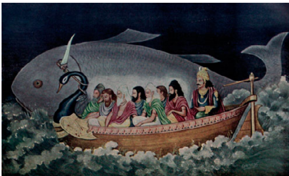
MATSJA IN MANU

Obstaja indijski mit, zelo podoben zgodbi o babilonskem bogu Ei. Bog Višnu se je na Zemlji večkrat utelesil kot avatar. Prva inkarnacija sovpada s časom potopa, v kateri je Višnu, ki je prevzel obliko ribe (Matsja), nekega dne plaval v jezeru. Vaivasvata Manu, veliki gospodar kali juge, ga je opazil in mislil, da gre za navadno ribo, a ta ga je prosila, naj jo potegne iz jezera, v zameno pa mu obljubila svojo zaščito. Vaivasvata Manu reši boga, ki pa mu pove, da se približuje potop. Manu po nasvetu Višnuja zgradi ladjo. Majhna riba je rasla zelo hitro in dosegla velikost celotnega oceana. Ko je prišlo do velikega potopa, je potegnila Manujevo ladjo na varno.