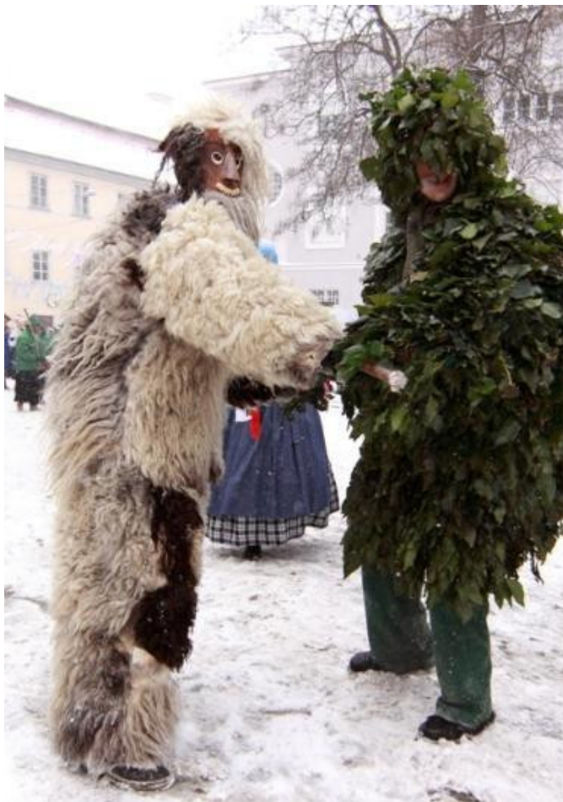
ZELENI JURIJ IN RABOLJ

V Pomurju je znan obred dvoboja med Zelenim Jurijem ali Vesnikom, odetim v bršljan ali cvetje, in Raboljem, oblečenim v slamo ali kožuh. Laufarski običaj v Cerknem prav tako ponazarja boj med zimo in pomladjo in spada v skupino vegetacijskih obredov, ki so prisotni v širšem alpskem prostoru.