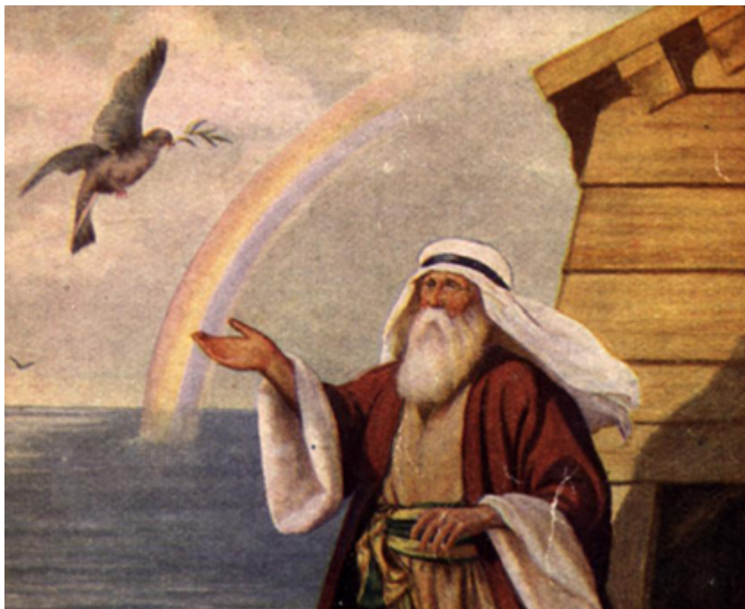
NOETOVA IN GOLOBICA Z OLJČNO VEJICO

»Zemlja pa je bila vedno bolj sprijena pred Bogom in polna nasilja.« /.../ »Bog je rekel Noetu: Sklenil sem, da je prišel konec vsega mesa, kajti napolnili so zemljo z nasiljem, zato, glej, jih bom uničil z zemljo vred. Ti pa si izdelaj ladjo iz cipresovega lesa. Naredi jo z več prostori in jo od znotraj in od zunaj premaži z zemeljsko smolo.«