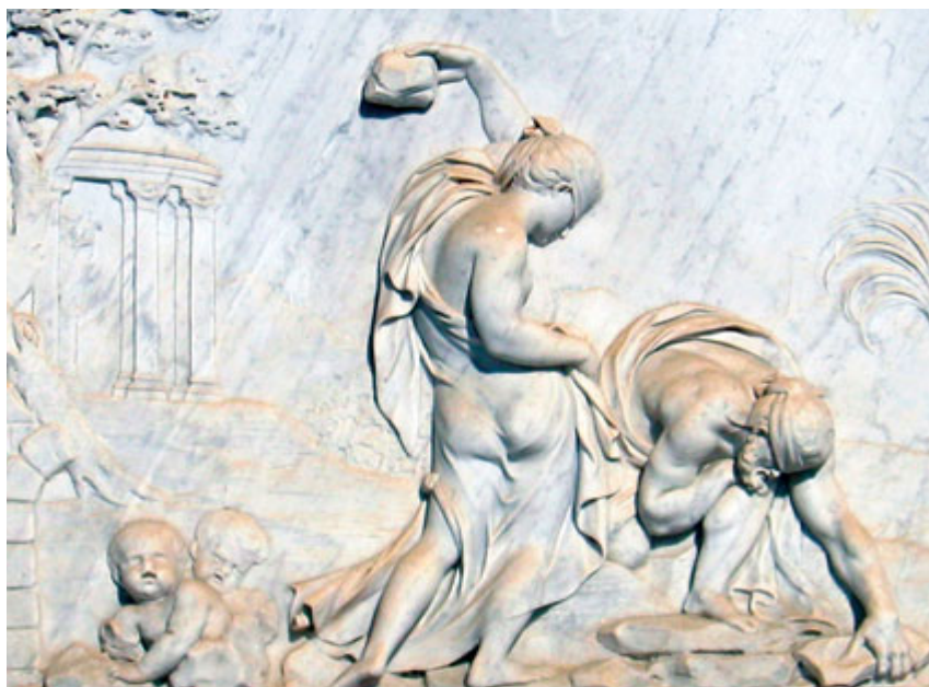
DEVKALION IN PIRA

Pri starih Egipčanih obstaja legenda o povodnji. Bog Tum, imenovan tudi Temu, Atem, ali Atmu, je črpal vode iz kozmičnega prepada in jih usmeril na zemljo, da bi potopil in uničil človeštvo. Umrli so vsi ljudje, razen tistih, ki so bili na Tumovi ladji.