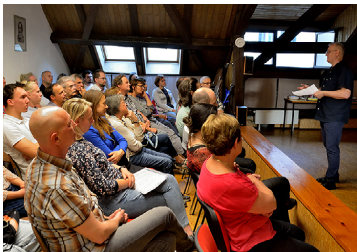
PREDAVANJE NA WOLFOVI V LJUBLJANI.