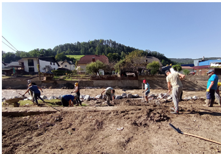
NA DELOVNI AKCIJI PO POPLAVAH 2023.

Prvi pomemben cilj v našem kratkoročnem načrtu je postati bolj prepoznavni v našem mikro okolju, predvsem preko našega Tečaja praktične filozofije . S tem tečajem želimo ljudem približati modrosti vzhodnih in zahodnih filozofskih tradicij ter jim omogočiti, da najdejo navdih in odgovore na osebna vprašanja in izzive. Vprašanja, o katerih so razmišljali Platon, Buda ali Konfucij, so še danes enako aktualna — vsak med nami se sooča z globokimi, eksistencialnimi vprašanji. Želimo, da čim več ljudi odkrije to bogastvo in spozna filozofijo kot praktično orodje za življenje.