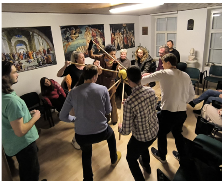
DELAVNICA SODELOVANJA V NOVI AKROPOLI V MARIBORU.

Filozofija ni namenjena le peščici izbranih. Vsakdo mora imeti možnost, da si zgradi svoje lastno mišljenje, da postane bolj svoboden, da išče svojo srečo in najde svoj smisel.