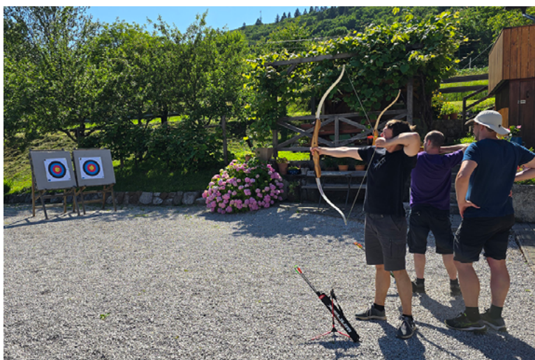
ŠPORTNI IZLET ČLANOV NOVE AKROPOLE.

Zato tudi naša predavanja niso strogo akademska ali intelektualna. Ne seciramo pojmov v nedogled. Predavanja so usmerjena k praktičnosti — k uporabi filozofije v vsakdanjem življenju. Ni pomembno, da vemo vse, kaj je rekel Platon, pomembno je, kako lahko Platon meni danes pomaga, da lažje hodim po svoji življenjski poti. Seveda to ne pomeni, da stvari banaliziramo. Filozofijo predstavljamo na razumljiv način, a ohranjamo njeno globino.