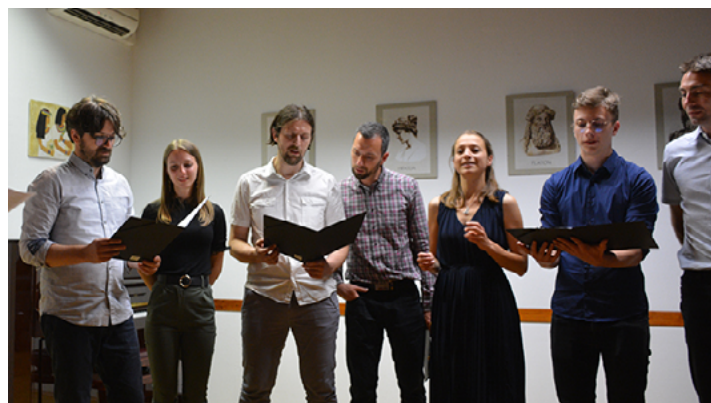
NASTOP ZBORA OB PROSAVI.

Četrty poudarek pa je namenjen večji vključenosti umetnosti v naše filozofsko delo. Glasba, na primer, ima izjemno moč — nagovarja naše srce na način, ki presega besede, in nas vodi od fizičnega sveta prek čustvenega k duhovnemu. Bila je temeljni element že v Konfucijevi šoli, in prepričani smo, da ima lahko enako pomembno vlogo tudi danes.