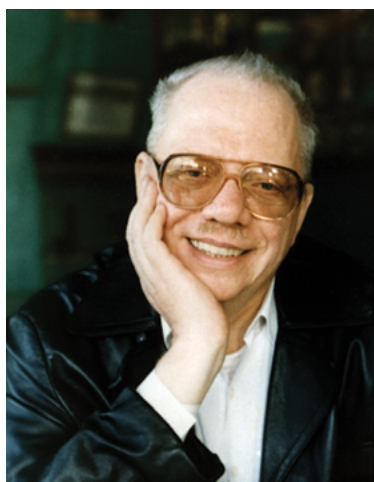
JORGE ANGEL LIVRAGA, USTANOVITELJ NOVE AKROPOLE.

Profesor Livraga je bil zame zgled filozofa. Čeprav je bil preprost in navaden človek, daleč od stereotipne podobe filozofa z dolgo brado, je iz njegovih besed izžarevala moč – moč idej, o katerih je govoril. Takrat sem začutil, da filozofija ni mrtva, da še vedno živi in da filozofi še hodijo po svetu.