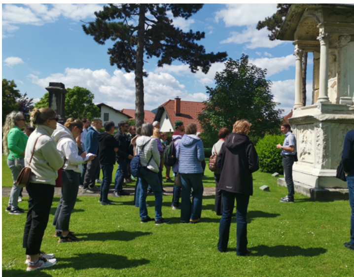
PREDAVANJE ZA ŠIRŠO JAVNOST V ŠEMPETRU V SAVINJSKI DOLINI.

Stari Rimljani so te prizore namenoma postavljali ob ceste, da bi jih mimoidoči lahko videli in se ob njih spominjali ne le svojih prednikov, temveč predvsem idej, ki dajejo življenju globlji smisel, ter jih hkrati opominjali na kratkost življenja in spodbujali k premisleku, kako izkoristiti čas, ki nam je dan.