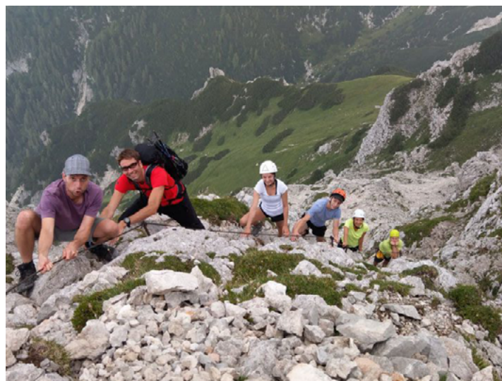
VZPON NA KALŠKO GORO.

Tretji projekt, ki ga razvijamo, je povezovanje filozofije s športom. Mednarodna Akropola je ustanovila Šolo športa , kjer telesna vadba ni le skrb za fizično kondicijo, temveč del celovitega pristopa k človekovemu razvoju — povezovanje telesa, duše in duha.