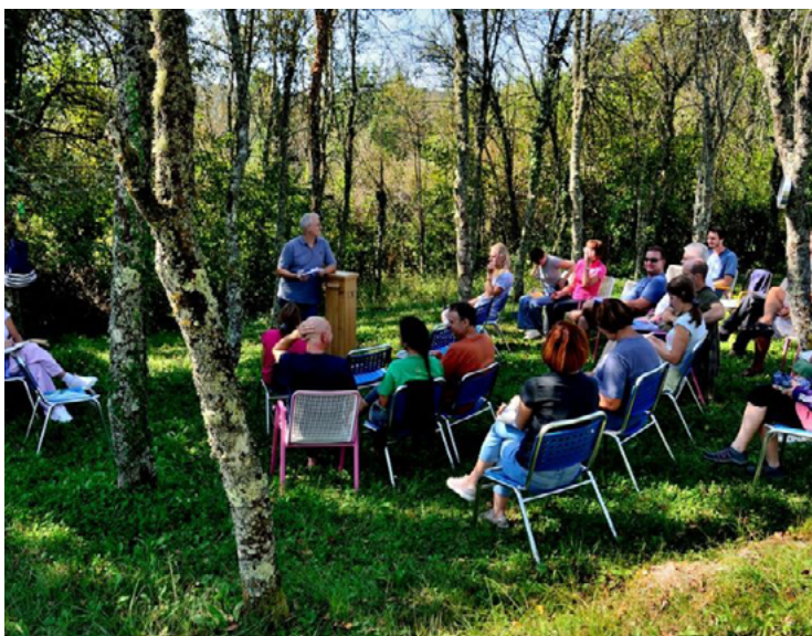
LETNI TABOR ČLANOV NOVE AKROPOLE.

V Novi Akropoli filozofijo razumemo tako, kot so jo nekoč — kot način življenja. Ne gre za to, da samo zbiramo znanje, ampak da ga znamo praktično uporabiti v vsakdanjem življenju. Filozofija nas uči, kako postati močnejši, boljši in plemenitejši človek. Kako se bolj zavestno, bolj pogumno in bolj modro soočiti z izzivi, ki nam jih prinaša življenje.