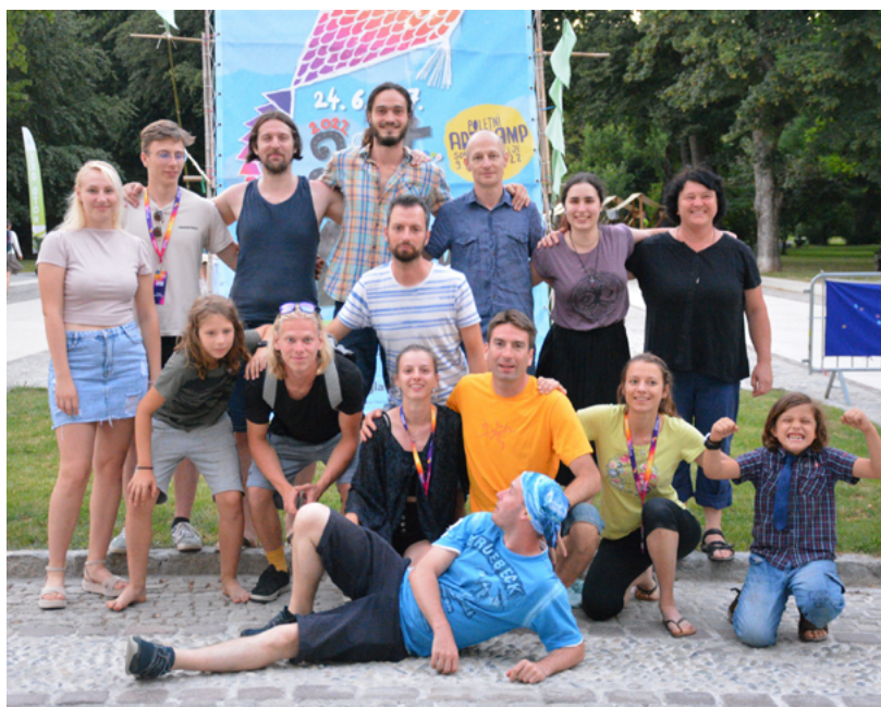
AKROPOLITANCI Z DELAVNICO FIZIKE NA ART KAMPU V MARIBORU.

Cilj Nove Akropole je torej globoko povezan s človekom kot posameznikom in tudi s človeštvom kot celoto. Ni vezan na noben narod, religijo ali ideološki sistem – niti na samo zunanjo strukturo Nove Akropole. Kajti to, kar šteje, je ideal, ki ga zastopa.